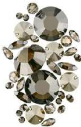
Crystal Bronze Shade